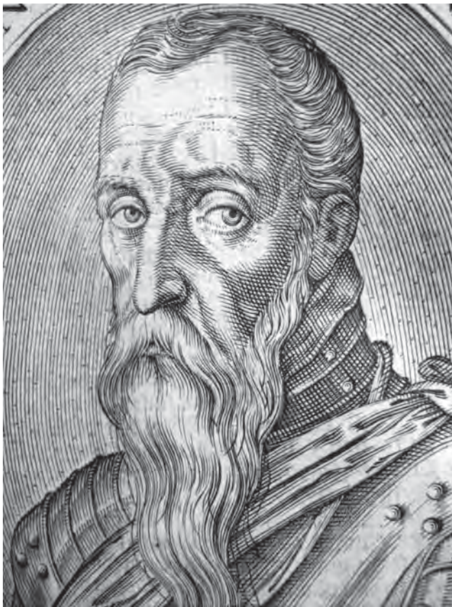
Afb. 5 Detail afbeelding Don Fernando de Toledo, hertog van Alva uit Van Meteren, Historie der Neder-landscher ende haerder Na-buren Oorlogen en Geschiedenissen (1614). Universiteitsbibliotheek Leiden 13 E 1.

In een ander pamflet werd er meer expliciet verwezen naar de boosdoener Maurits. De ‘Clachte over de verdruckte vrijheyd’, was ondubbelzinnig in de veroordeling van de stadhouder: