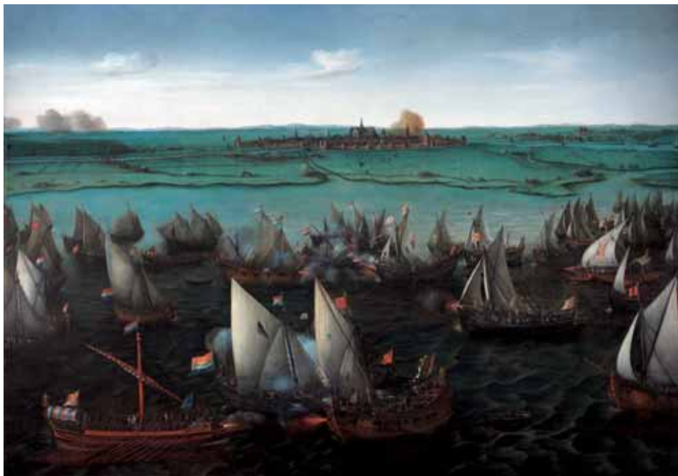
Afb. 5 De slag op het Haarlemmermeer , Hendrik Vroom, ca 1621, olieverf op doek, 190 x 268 cm. Rijksmuseum Amsterdam.

De gevelsteen geeft eveneens weer dat Haarlem vond dat het de Spanjaarden dapper had weerstaan en dat het zelf niet meer had kunnen doen in de strijd voor ontzet. Predikant Samuel Ampzing gaf in 1628 duidelijk weer waarom het beleg van Haarlem zo belangrijk was. Haarlem bewees door middel van het beleg dat de Spanjaarden niet onoverwinnelijk waren. Bovendien gaf de stad door te vechten andere steden de gelegenheid zich te versterken. 39 Ampzing suggereert dus dat de andere steden Haarlem dank verschuldigd waren vanwege het zo lang afhouden van de vijand. Hij creëert op deze manier een soort trots op een beleg dat uiteindelijk verloren ging.