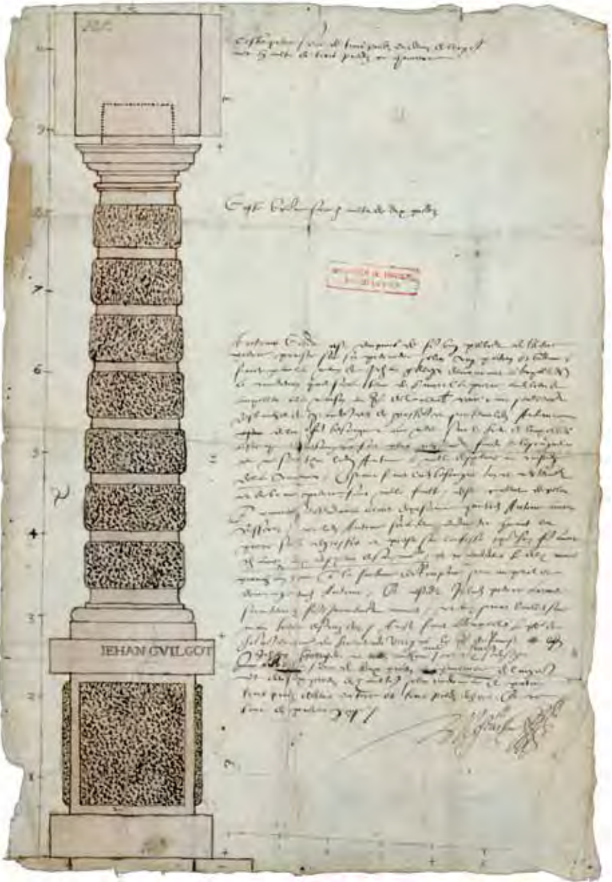
Afb. 2 Zuil van Culemborg, Algemeen Rijksarchief Brussel, Kaarten en plannen in handschrift, nr. 2.810.