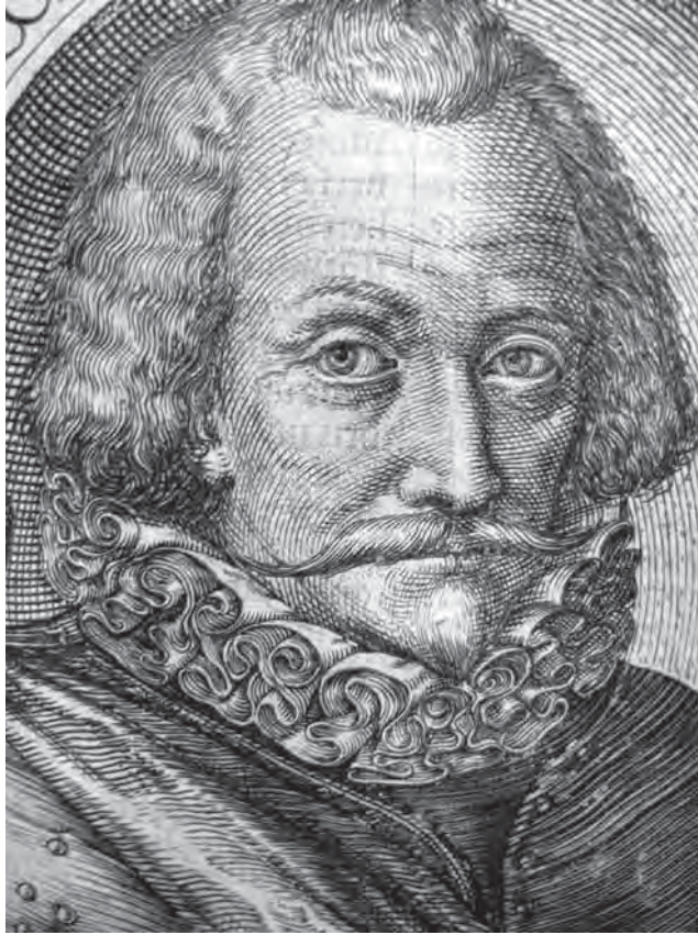
Afb. 4 Detail afbeelding Graaf Filips van Hohenlohe uit Van Meteren, Historie der Nederlandscher ende haerder Naburen Oorlogen en Geschiedenissen (1614). Universiteitsbibliotheek Leiden 13 E 1.