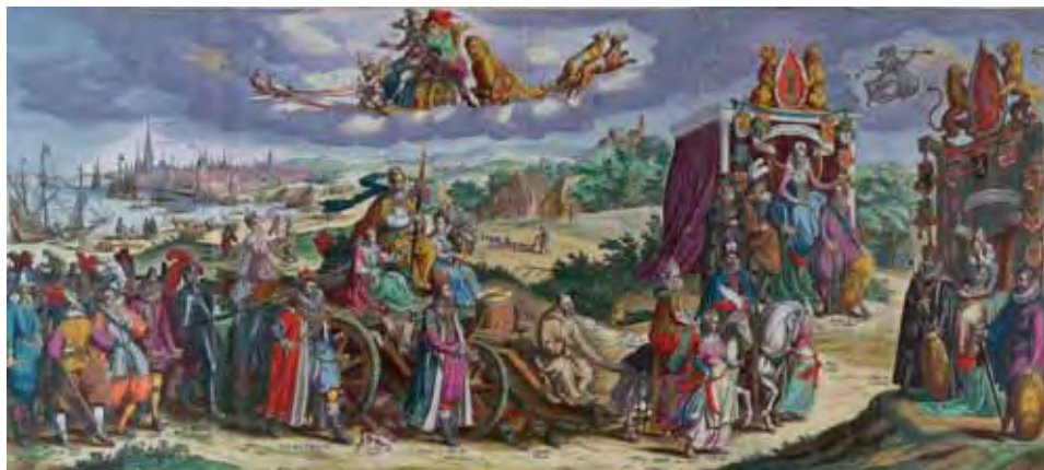
Afb. 1 Afbeldinghe van 't nederlands bestandt, ets uit 1609. De personen die worden afgebeeld zijn: Prins Maurits, Jan Neyen, Koning Filips IV, Ambrogio Spinola, Albrecht van Oostenrijk, aartschertogin Isabella, koning Hendrik IV, koning Jacobus II en Mars en Venus.

'Bestandstwisten'. Deze twisten hadden hun oorsprong in een theologisch debat tussen de twee Leidse hoogleraren Gomarus en Arminius over het complexe leerstuk van de dubbele predestinatie (afb. 2). Tot afgrijzen van de eerste had Arminius de verkiezingsleer genuanceerd door aan de mens een (zeer) beperkte vrije wil toe te kennen. Deze opvatting was in Gomarus' ogen in strijd met de calvinistische belijdenisgeschriften, waardoor er in de gereformeerde kerk niet langer plaats was voor de Arminianen. De compromisloze houding van Gomarus op dit punt werd door de Arminianen als een ernstige vorm van gewetensdwang geïnterpreteerd. 8 Binnen de kortste keren raakte dit theologische conflict op nauwelijks ontwarbare wijze verstrengeld met een serie politieke meningsverschillen over de te voeren buitenlandse politiek, de verhouding tussen kerk en staat en over de reikwijdte van de provinciale autonomie. De Bestandstwisten verdeelden het land in twee kampen: de Arminianen of remonstranten met landsadvocaat Oldenbarnevelt als voorman, en de Gomaristen of contraremonstranten, die op de sympathie van stadhouder Maurits konden rekenen. Zoals bekend delfden de remonstranten in dit geschil het onderspit, met als tragisch dieptepunt de onthoofding van Oldenbarnevelt wegens landverraad. 9