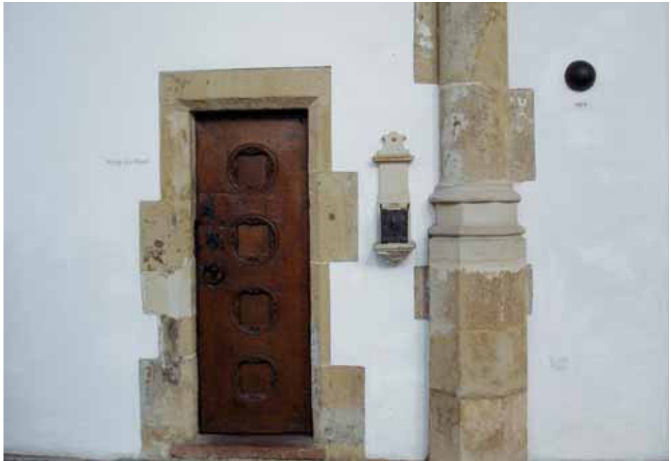
Afb. 2 Kanonskogel in Grote of St. Bavokerk in Haarlem.

het beleg. In de 19de eeuw verplaatste men deze kogels naar het interieur van de Janskerk. 20