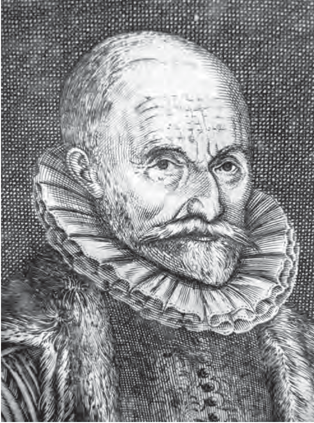
Afb. 3 Detail afbeelding Emanuel van Meteren uit zijn Historie der Neder-landscher ende haerder Na-buren Oorlogen en Geschiedenissen (1614). Universiteitsbibliotheek Leiden 13 E 1.

tiatieven die soms wel en soms niet gesteund werden door locale of nationale overheden. 19