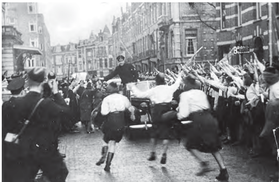
Afb. 2 NSB-voorman Mussert wordt in Amsterdam onthaald door jongens van de Jeugdstorm. Collectie NIOD beeldnummer 77781.

openbaarheid. De NSB was niet alleen een protestpartij, maar bracht ook een nationaalsocialistisch geloof in een nieuwe volksgemeenschap met zich mee. Veel leden waren uit overtuiging lid. De keuze voor de NSB is dus niet louter aan toeval te wijten, maar werd ook door karakter en overtuiging bepaald.