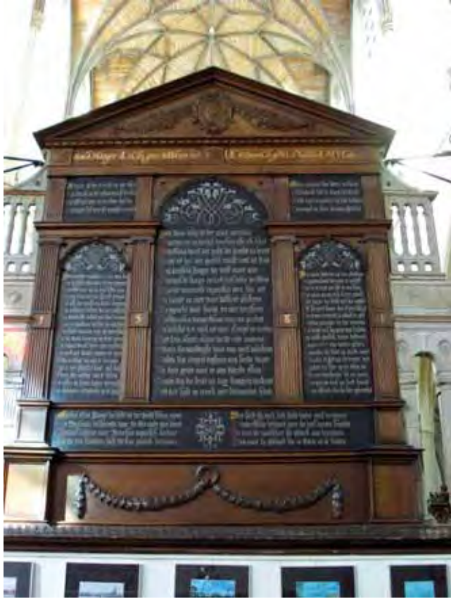
Afb. 4 Kerkbord 'Het beleg van Haarlem' in Grote of St. Bavokerk in Haarlem.

De vijand die het bord beschrijft, wordt niet direct gekarakteriseerd als een geloofsvijand, maar bovenal als een buitenstaander die Haarlem onderdrukte. Haarlem vocht tegen het 'Spaensch geweld' van de koninklijke legers en niet tegen een katholieke vijand. 37 Dit is een relatief milde boodschap van de kerkmeesters op het moment dat het ware geloof al had overwonnen binnen Haarlem. Het jaartal 1581 ondersteunt deze boodschap, omdat Haarlem in dit jaar Haarlem het katholicisme verbood. In plaats van de overwinning van de gereformeerden te propageren, concentreert het kerkbord zich op wat de burgers samen hadden doorstaan.