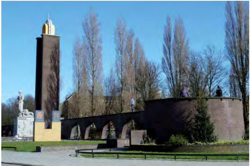
Monument Indië-Nederland (23 maart 2011).

jaar later. Er was nauwelijks belangstelling. En dat terwijl de inzet van de discussie destijds niets minder was geweest dan af te rekenen met een foute koloniale erfenis. Zo werd het althans vooral vanuit politieke hoek voorgesteld. Uit de gespreksrondes die Clingendael met verschillende betrokkenen organiseerde, bleek dat het Van Heutsz-monument voor verschillende groepen een fundamenteel andere betekenis had. Veel politici noemden het monument een ‘ereteiken’ voor iets wat naar huidige maatstaven een ‘massamoord’ zou worden genoemd. Het ongewijzigd laten van het monument betekende voor hen het ongewijzigd laten van een anachronistisch oordeel over kolonialisme. In het academische discours werden verleden en monument losgekoppeld: een oordeel over het verleden lag niet besloten in het monument, dat dus niet als ‘publieke herinnering’ vertaald mocht worden. Het was zélf geschiedenis, en daarom vooral een interessant object dat in zijn context moest worden gezien. De historici stelden voor om slechts tekst en uitleg bij het monument te geven, en het verder zo te laten.