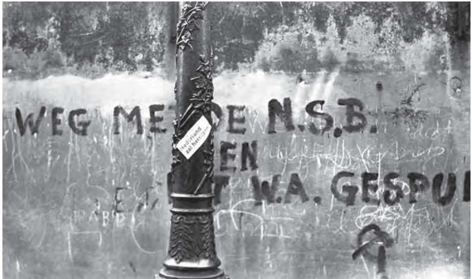
Afb. 3 Een tegenstander van de NSB laat in augustus 1941 een boodschap achter in de Nova Zemblastraat in de Spaarndammerbuurt in Amsterdam.

die een onderzoeker of documentairemaker maakt heeft consequenties voor het beeld dat er ontstaat, gewild dan wel ongewild.