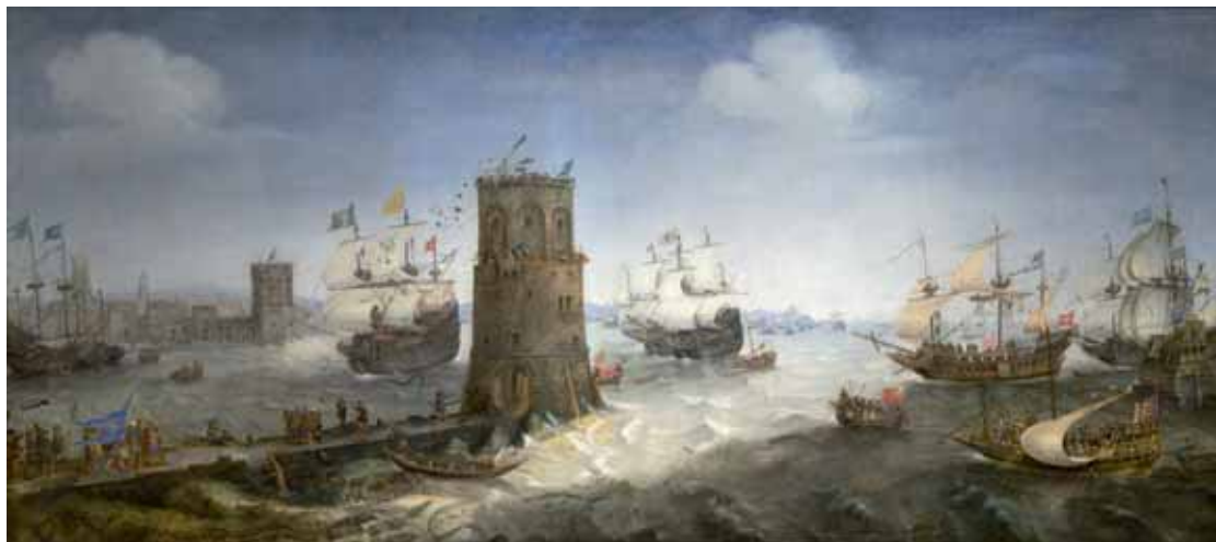
Afb. 1 De inneming van Damiate, Cornelis Claesz van Wieringen, ca 1625, olieverf op doek, 100 x 200 cm, Frans Halsmuseum, Haarlem.

de drang van Haarlem een stedelijk narratief te creëren dat de bevolking, waaronder de vele immigranten, bijeen bracht. 5