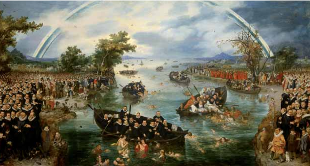
Afb. 4 Adriaen P. van de Venne (1589-1662), De zielenvisserij: allegorie op de ijverzucht van de verschillende religies tijdens het Twaalfjarig Bestand tussen de Nederlandse Republiek en Spanje , schilderij, olieverf, 98,5 cm x 187,8 cm. Rijksmuseum Amsterdam.

Op het schilderij zien we een rivierlandschap. Daarin bevinden zich grote groepen mensen aan beide oevers van de rivier, op het water bevinden zich enkele roeiboten. Aan de horizon een regenboog. Aan de linkerzijde de Protestanten en hun aanhangers, de prinsen van Oranje, Maurits en Frederik Hendrik, Frederik v van de Palts, Jacobus I, koning van Engeland en de jeugdige Lodewijk XIII, koning van Frankrijk met zijn moeder Maria de' Medici. In de boot op de voorgrond bevinden zich de protestantse vissers, hun netten zijn gemerkt met Fides, Spes en Charitas. Aan de rechterzijde bevinden zich de katholieken en hun aanhangers: de aartshertogen Albrecht en Isabella, generaal Ambrosio Spinola en de paus gedragen door kardinalen. In het katholieke bootje vissen priesters onder leiding van een bisschop.