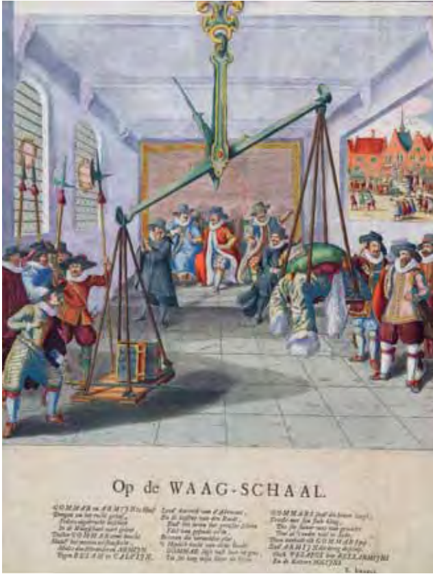
Afb. 2 Jacobus Arminius en Franciscus Gomarus 'op de 'Waagschaal', gravure uit 1618. Atlas van Stolk.

dige eenheid zonder vanzelfsprekende verbindende factoren zoals een gemeenschappelijke religie of een dynastieke traditie. Het levend houden van de herinneringen aan de gruweladen van de Spanjaarden was in dit licht een begrijpelijke strategie. Het creëren van een Nederlands equivalent van de 'Zwarte Legende' bleek een buitengewoon effectief middel om de diverse bevolking van de Republiek tot een eenheid te smeden. In de strijd tegen de gemeenschappelijke Spaanse vijand konden alle inwoners, van welke gezindte of achtergrond dan ook, gezamenlijk optrekken. 11 Antihispanisme, de ruggengraat van de Opstandscanon, lijkt echter niet het meest probate middel om een tegenstander uit eigen land onschadelijk te maken. Dat roept de vraag op hoe het gebruik van het Opstandsverleden in die andere context in zijn werk ging. Via een drietal case-studies wil ik analyseren op welke wijze en met welk oogmerk de antagonisten van de Bestandsjaren dan wél de herinneringen aan de Opstand