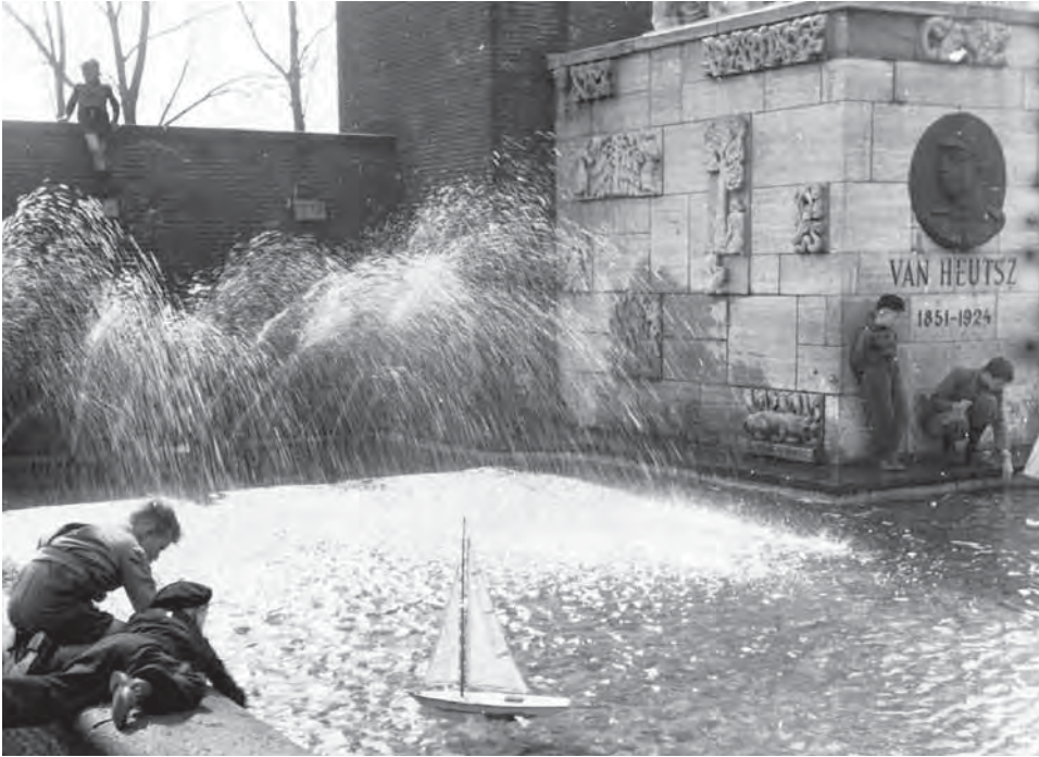
Olympiaplein, de speelvijver aan de voorzijde van het Van Heutszmonument in de jaren vijftig van de vorige eeuw.

politiek deze keer gewilliger bleek. Het stadsdeel nodigde Instituut Clingendael uit om met verschillende betrokkenen in overleg te treden, het draagvlak voor naams- en functiewijziging te onderzoeken en daarover een advies uit te brengen. Op basis daarvan werd in 2001 besloten het monument om te dopen tot 'Monument Indië – Nederland'. Het zou veranderen van 'eretekens voor Van Heutsz' in een 'herinnering aan de relatie tussen Nederland en Indië tijdens de koloniale periode'.