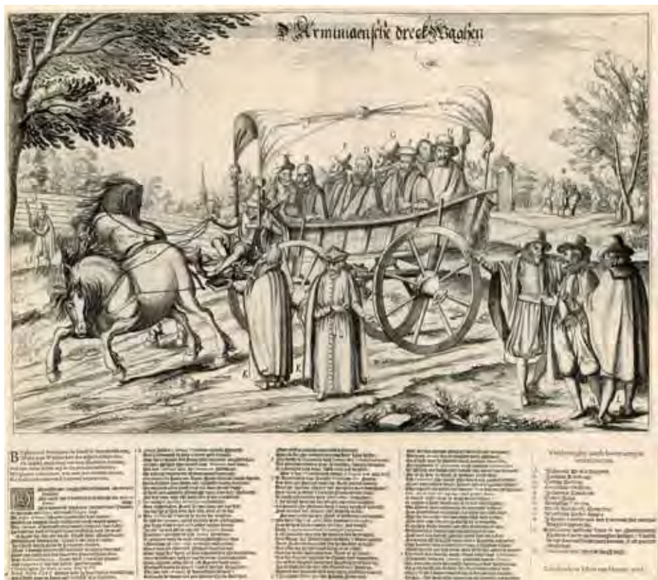
Afb. 3 Anoniem, D'Arminiaensche dreckwaghen . Spotprent op de arminianen uit 1618, ets, vervaardigd in de Noordelijke Nederlanden. Rijksmuseum Amsterdam.

De voorstelling toont hoe de belangrijkste vertegenwoordigers van de remonstranten en enkele andere hervormers in een wagen worden afgevoerd. De wagen wordt getrokken door twee wilde paarden genaamd 'onenichheit' die allebei een andere kant uit willen gaan. In de wagen zitten Johannes Wtenbogaert (op de bok), Jacobus Arminius, Petrus Bertius, Conradus Vorstius, Jacobus Taurinus, David Joris, Adolphus Venator, Dirck Volkertsz Coornhert en de 'Afvallighe Wederdooper'. Voor de wagen staan twee jezuïeten. Rechts op de voorgrond proberen twee arminianen tevergeefs ook een contraremonstrantse predikant op de wagen te krijgen. De man links met een brandende fakkel wijst de wagen de weg en stelt Johan van Oldenbarnevelt voor. Onder de voorstelling is een tekstblad geplakt van vijf kolommen met twee verzen en een legenda A-O in het Nederlands.