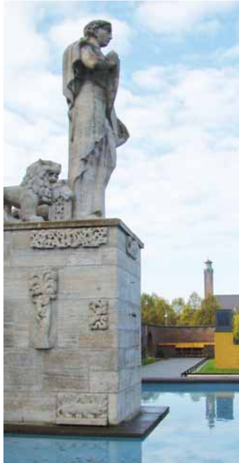
Monument Indië-Nederland.

De morele verontwaardiging die aan de herziening van het monument ten grondslag lag, staat in contrast met de gemoedelijke en a-politieke afronding van dit project, ruim tien (!)