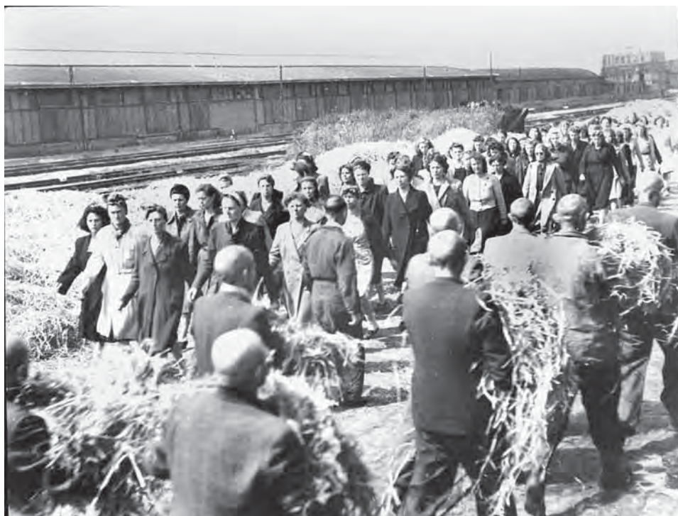
Afb. 1 Gedetineerden van de Levantkade dragen in juni 1945 stro naar hun slaappleatsen.

politieke delinquenten en Duitsers wordt vergeleken met dezelfde groepen in andere West-Europese landen of met de rest van de Nederlanders komt er een ander beeld naar voren.