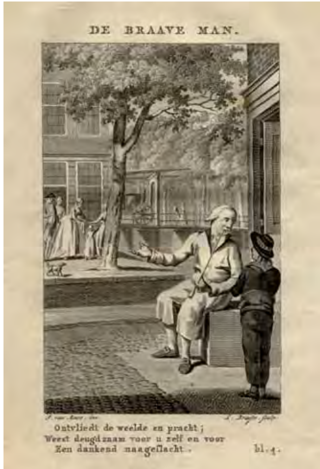
Afb. 1 De braave man. Het ideaalbeeld van de mens volgens de Maatschappij tot Nut van 't Algemeen.

De volksopvoeding en de inrichting van het onderwijs waren onderwerp van uitgebreide discussies. Concreet richtte de maatschappij zich op het ontwikkelen van lesmateriaal en het oprichten van scholen en kweekscholen voor onderwijzers. In 1791 werd de eerste niet-commerciële uitleenbibliotheek van Nederland, en zelfs van Europa, door het Nut geopend in Haarlem. 16 In 1796 kwam in dezelfde stad een kweekschool voor onderwijzers en in 1801 opende een departementale school zijn deuren. 17 Maar ook buiten het Nut was er aandacht voor onderwijs. Er verscheen in de 18de eeuw steeds meer literatuur over onderwijs en in 1792 werd zelfs een prijsvraag uitgeschreven over de vraag hoe scholen leerlingen het beste konden straffen en belonen. 18 Dat het onderwijs in de 18de eeuw een warme