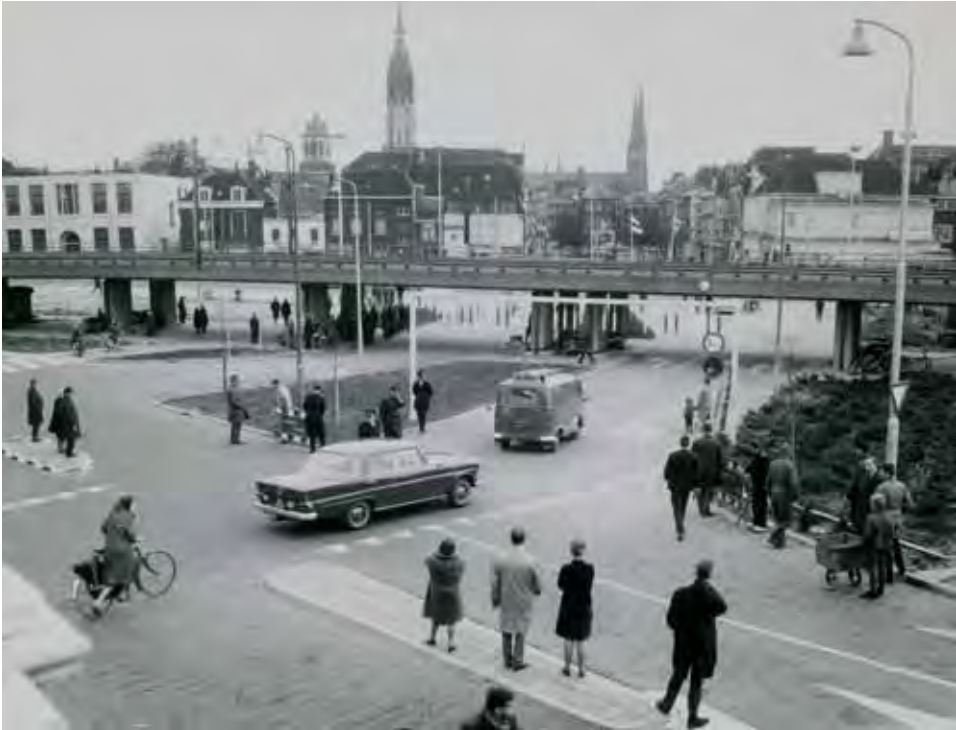
Afb. 2 1967-2015: het luchtspoor door Delft op de kruising Binnen-Buitenwatersloot-Westvest/Phoenixstraat vlak na de opening.

arm genomen, een stedenbouwkundige adviseur die niet bang was voor grote ingrepen in de historische binnenstad. Het idee voor het moderne betonnen luchtspoor kwam uit zijn koker.