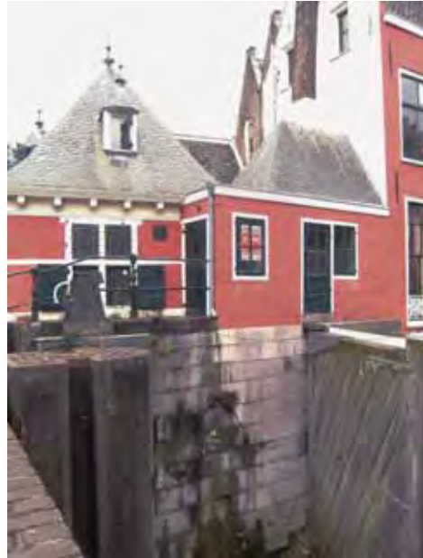
Afb. 7 Haven met afgesloten sluisdeur en tolhuis (achterzijde).

Internationaal verplaatst de aandacht zich steeds meer van monumenten naar monumentale ensembles. Zo is de Amsterdamse grachtengordel deze zomer als uniek cultureel erfgoed op de werelderfgoedlijst geplaatst. Het is maar de vraag of het voor Gouda de moeite zou lonen om een plaats op die lijst te verwerven. Niet omdat het Goudse ensemble onder zou doen voor dat van Amsterdam, maar omdat de economische meerwaarde