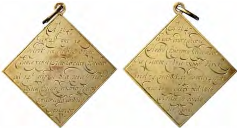
Afb. 2 'Gedenkpenning van de eerste steenlegging van de toren van de nieuwe kerk', 1647, koper 7.8 x 7 cm. Collectie Backer stichting in bruikleen aan het AHM (PB 22).

mer 25). Die steen is overigens nog steeds te zien.