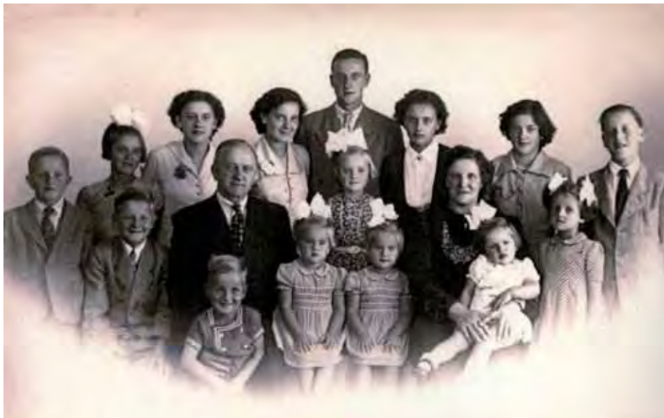
Afb. 2 Kruidenier De Boer uit Heerhugowaard had 15 kinderen, foto uit 1952.

Bijna iedereen kwam uit een gezin met een eigen bedrijf: dat geldt voor 24 van de 27 mensen. Dertien mensen werden geboren in een tuinders- of boerengezin, elf mensen als kind van andere zelfstandigen zoals bakker, aannemer, kruidenier, molenaar, caféhouder, schillenboer, zadelmaker of timmerman. Verder zijn er drie kinderen van arbeiders.