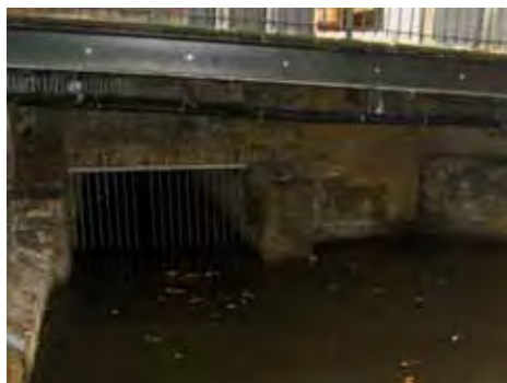
Afb. 3 De gracht van de verdwenen Motte van Gouda met in het midden de ingang van de gerestaureerde overkluizing.