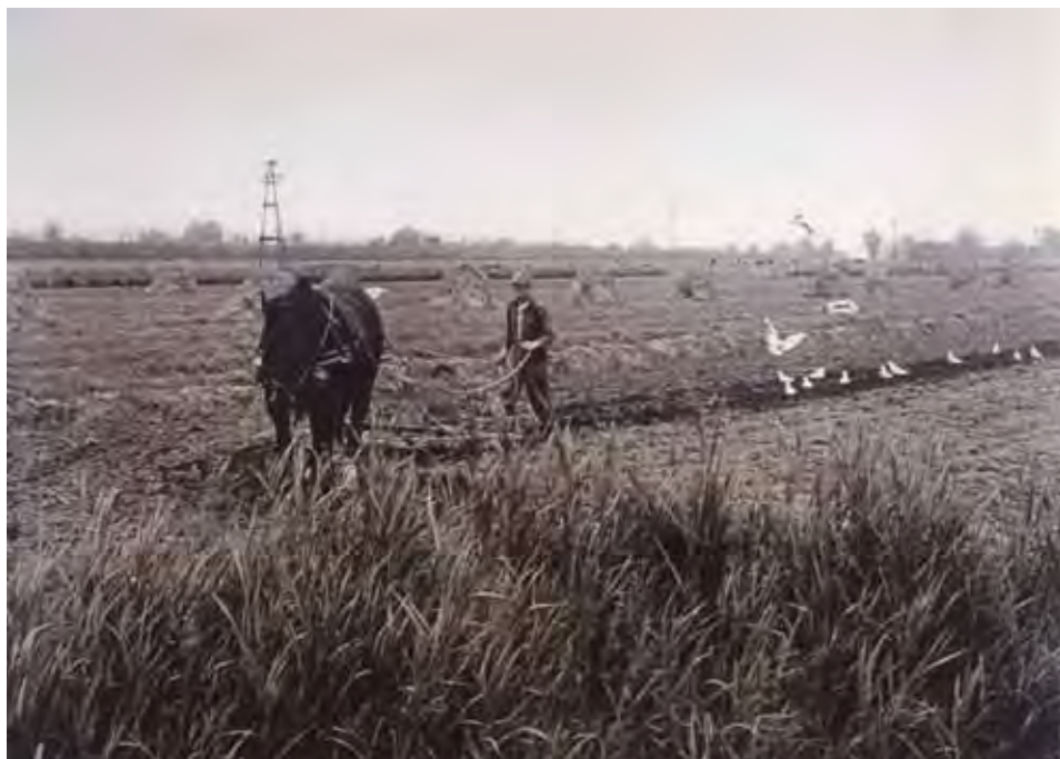
Afb. 6 Adrie Hoogewerf uit Wognum aan het werk op het land. Foto uit 1962.

‘verzet en onwilligheid’ van ouders, de laatste keer het meest op het platteland. 21 Bij de veranderingen in de jaren vijftig/zestig kan leerplichtverlenging echter geen rol hebben gespeeld; die zou pas weer in 1971 plaatsvinden. Ook wetgeving die het werken door kinderen beperkte, zal een geringe rol hebben gespeeld. Tussen 1919 en 1955 veranderde er nauwelijks iets in deze wetgeving. Deze verbood het laten werken van kinderen tot veertien buiten het eigen gezinsverband, met uitzondering van werk in de landbouw. In 1955 werd die laatste uitzondering geschrapt, zodat het vanaf dat moment verboden was om kinderen bij iemand anders op de boerderij of tuinderij te laten werken. 22 Maar dat zal weinig gevolgen hebben gehad; het gros van het agrarisch werk werd immers verricht door kinderen uit het eigen gezin (afb. 6).