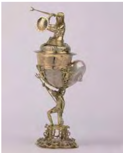
Afb. 3 Jörg Ruel, 'knobbelhoornbeker met verguld zilveren montuur', ca. 1625. Het Backerwapen is later aan het object toegevoegd. 48.4 x 19.1 x 19.5 cm. Collectie Backer stichting in bruikleen aan het Rijksmuseum (BK-BR-562) a.