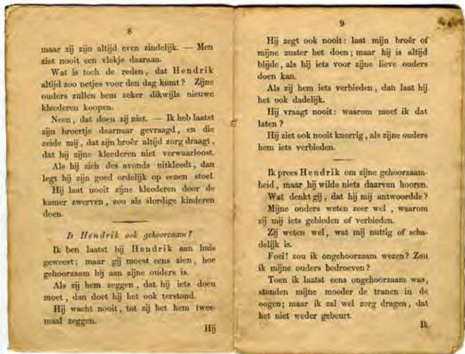
Afb. 5 Fragment uit De brave Hendrik, een leesboekje voor jonge kinderen uit 1870.