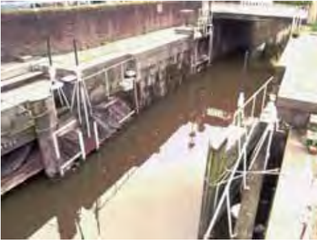
Afb. 4 De Donkere Sluis met vooraan de kruisdeuren in geopende toestand.

recent resultaat van het Consortium Hollandse Waterstad zien. De smalle waterloop naast de Sint Janskerk loopt uit op de vroegere ringgracht van de verdwenen motte. Mogelijk is dit ook de oorspronkelijke loop van de Gouwe. Waar de gracht onder de behuizing van de Dubbele Buurt verdwijnt, bevindt zich een overkluizing uit de 15de eeuw, die waarschijnlijk rond 1780 is verbreed en verbouwd. In het voorjaar van 2009 is de overkluizing grondig gerestaureerd (afb. 3). Sindsdien is de onderdoorgang onderdeel van de Goudse Kanoroute. Als een van de weinige overgebleven 18de-eeuwse waterwerken van dit type, is dit een monument van nationaal belang.