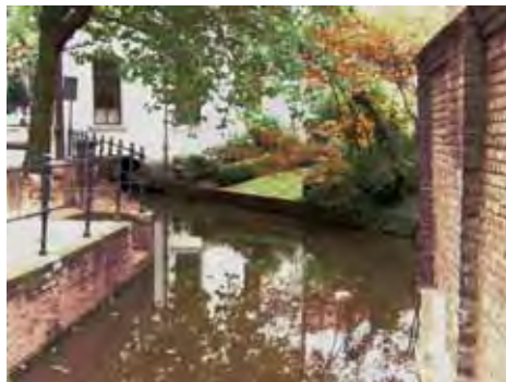
Afb. 2 De gracht van de verdwenen Motte van Gouda, rechts de tuin van de kosterij met de nog zichtbare verhoging.

Inmiddels is water als belangrijk element in de stadsgeschiedenis volledig ingebed in het gemeentelijke erfgoedbeleid. Om een einde te maken aan het gebrek aan samenhang in de historische binnenstad, had de gemeente Gouda in 2006 een stadsvisie vastgesteld. Daarin kregen de historische waterlopen een even belangrijke plaats als de vele monumentale gebouwen. In de stadsvisie werden drie kernambities geformuleerd om de historische identiteit van de stad te behouden. Ten eerste de stad weer terug brengen naar de rivier door het heropenen van de Havensluis en ontwikkelen van het havenfront. Ten tweede de binnenstad weer bevaarbaar maken en enkele gedempte grachten opengraven. En tenslotte het stimuleren van de dynamiek in het historische stadscentrum (afb. 1).