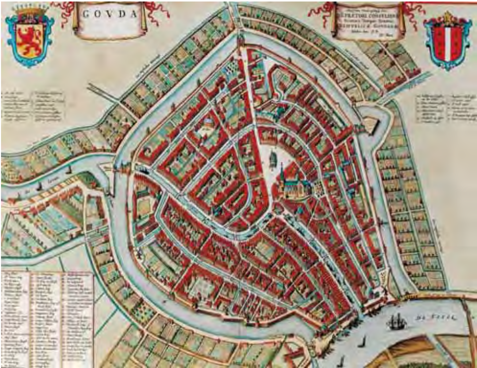
Afb 1 Historische plattegrond van Gouda in 1649. Titel: Gouda . Uit de atlas van Joan Blaeu. Groene Hart Archieven.

lijkheden om historische sluisen en bruggen te behouden en om ooit gedempte grachten weer open te graven. Het gemeentebestuur raakte mede daardoor overtuigd van de grote cultuurhistorische waarde van het eeuwenoude watersysteem van de stad en ontdekte een toeristische trekpleister met een aanzienlijk ontwikkelingspotentieel. Het motto van het Watergilde ‘als het water weer gaat stromen krijgt Gouda zijn ziel terug’ vindt sindsdien in steeds bredere kring weerklank.