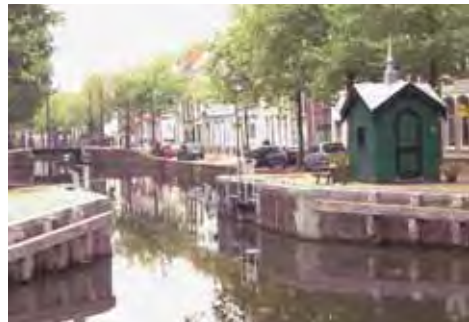
Afb. 5 Amsterdams Verlaat met in 2008 op initiatief van omwonenden herbouwd sluiswachterhuisje.

Gouda alleen kan niet in het ontstane tekort van meer dan een miljoen euro voorzien, zodat de ontdemping op de lange baan is geschoven. Intussen wordt gezocht naar goedkopere technische oplossingen en aanvullende financieringsmogelijkheden. Bij de herinrichting van het gebied wordt wel rekening gehouden met een toekomstige ontdemping en er is een Fonds Nonnenwater opgericht.