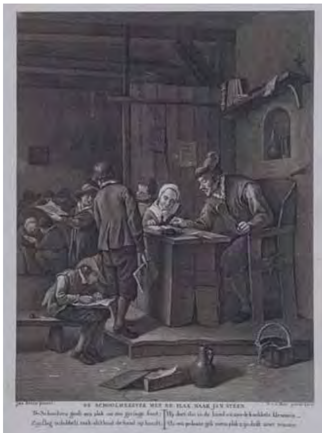
Afb. 3 De schoolmeester met de plak, naar Jan Steen. Het straffen met de plak werd door de schoolwet van 1801 verboden. 'De Schoolvos geeft een plak om een geringe fout; Zijn slag is dubbelt raak als 't kind de hand op houdt; Hij doet die in de hand en aan de knokkels klemmen; 't Is een pedante gek wiens plak zijn drift moet temmen.' Collectie Atlas Van Stolk, Rotterdam.

Het landsbestuur benoemde nu schoolopzieners, die moesten toezien op de uitvoering van de wet en verslag uitbrachten aan de Agent van Nationale Opvoeding. De schoolopzieners legden schoolbezoeken af in hun regio en werden geacht een vertrouwensband met de onderwijzers op te bouwen, er op toe te zien dat er het hele jaar onderwijs gegeven werd en onderwijzersexamens af te nemen. 27 Aanvankelijk waren er slechts acht opzieners, maar dit aantal werd al snel uitgebreid tot vijftig. De departementen werden onderverdeeld in districten, die ieder door een schoolopziener werden bediend. In de dorpen en kleine steden werd de regionale schoolopziener vaak bijgestaan door een plaatselijke functionaris. In de grotere steden stelde het gemeentebestuur, in overleg met de schoolopziener, een plaatselijke schoolcommissie samen. 28 De schoolcommissie van Haarlem telde zes leden.