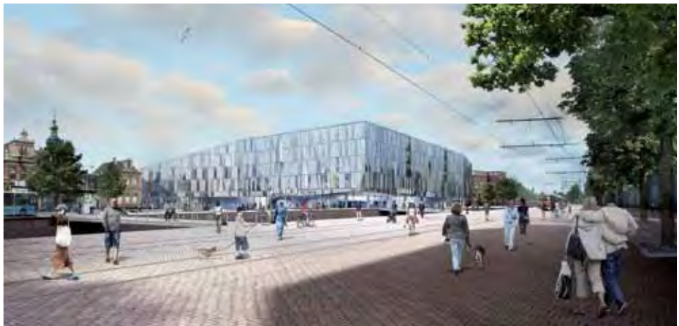
Afb. 3 2015; het toekomstige gecombineerde station-stadskantoor ontworpen door Mecanoo, met links in beeld het oude station uit 1885 dat een horecabestemming krijgt. Ontwikkelingsbedrijf Spoorzone Delft.

eeuwse panden aan de Van Leeuwenhoeksingel heeft onder protest van de bevolking het loodje gelegd. De chalet-stijl-gevel van het 19de-eeuwse stadskoffiehuis is door een bevoegen architect nog net op tijd uit de container van de slopers gevist. Er wordt draagvlak gezocht om deze binnen de nieuwe spoorzone een plek te geven.