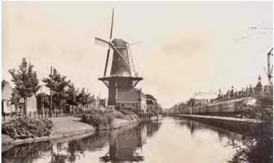
Afb. 1 1847-1960: de spoorlijn langs de Westersingel op maaiveldniveau.

terialen exploiteerde, vanaf 1800 tot 1924 een complex waar voor verschillende soorten militaire behoeften werd geproduceerd. Later werd het een politiegarage en tenslotte een kleinschalig bedrijfsverzamelgebouw. Om het complex binnen de stad te kunnen leggen, werd een knik in het spoortracé gelegd; deze belemmert de doorgaande treinen tot op vandaag om Delft op volle snelheid te passeren.