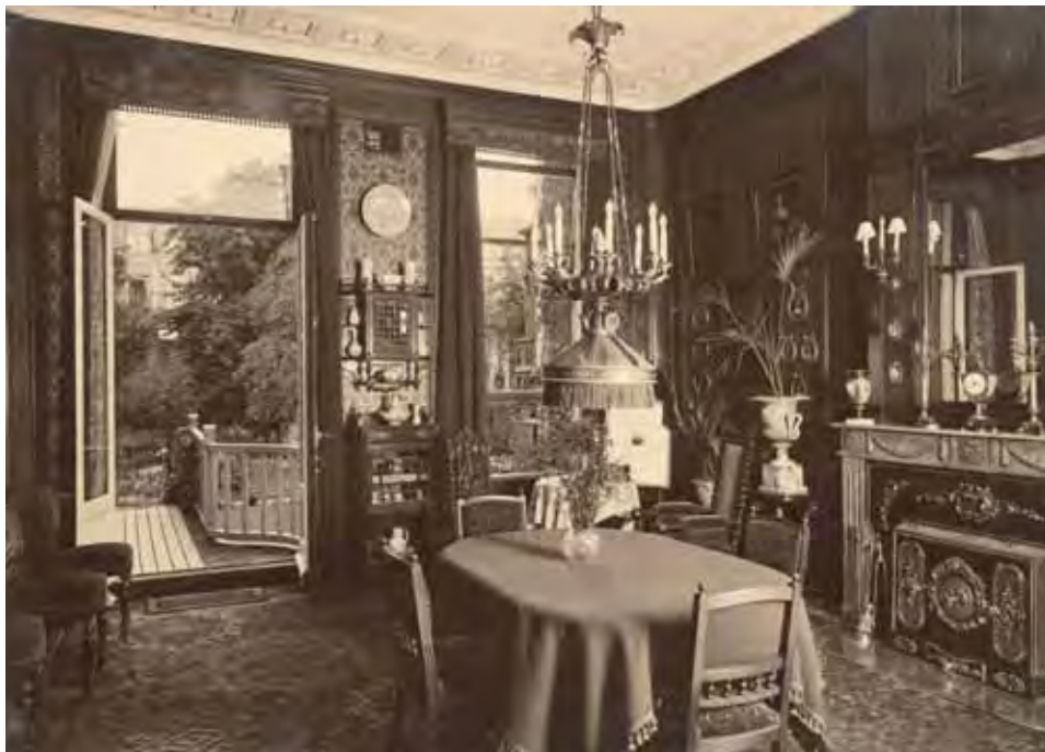
Afb. 6 Interieur van de eetkamer in het Backerhuis aan de Keizersgracht 567, ca. 1910.